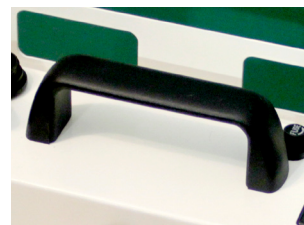
Pratica e robusta maniglia di trasporto